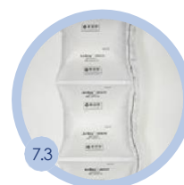
7.3 200 x 210 mm 700 bm