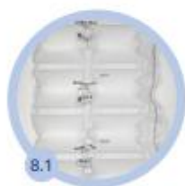
8.1 2 veľké komory 420 mm - 450 bm