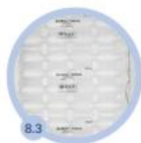
8.3 4 komory 420 mm - 450 bm