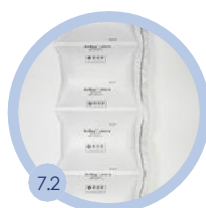
7.2 150 x 210 mm 700 bm