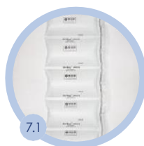
7.1 100 x 210 mm 700 bm