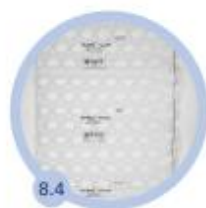
8.4 8 komôr 420 mm - 450 bm