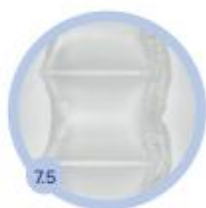
7.5 240 x 300 mm 600 bm