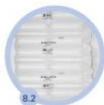
8.2 2 komory 420 mm - 450 bm